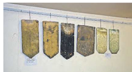
Ziegel aus verschiedenen Materialien.