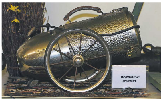
Staubsauger gibt es schon sehr lange. In ihren Anfängen sahen sie so aus.

che Besucher in aller Regel wenig Interesse an Motoren, sagt sie. Dennoch gibt es auch für die Damen im Museum einiges zu entdecken. Zwischen Autos, Traktoren, Motorrädern und Motoren sind nämlich antike Gerätschaften und Gegenstände aus Haushalt und Landwirtschaft sowie Puppen liebevoll drapiert. Einige davon haben die Mitglieder der Besitzerfamilie in ihrer Kindheit begleitet.