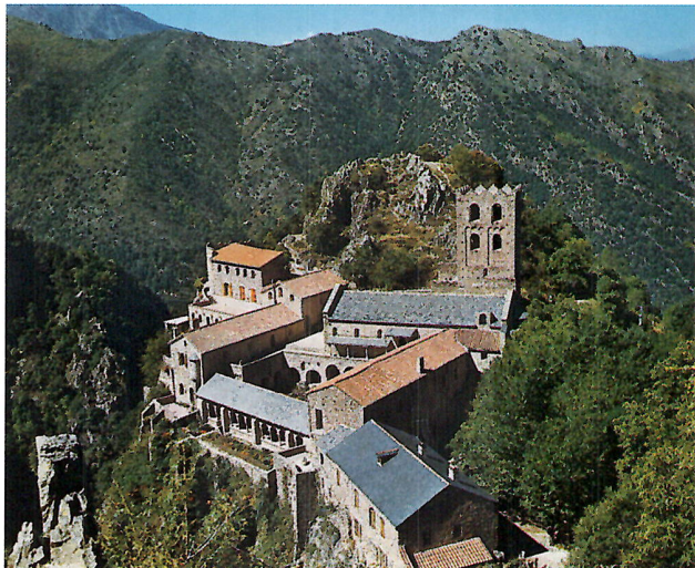
Benediktinerkloster Saint-Martin-du-Canigou in den Pyrenäen, gegründet um 1000